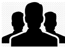
Анализ целевой аудитории